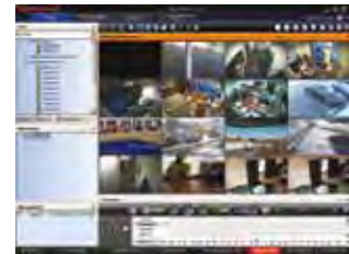
MAXPRO VMS Client Viewer 4x4