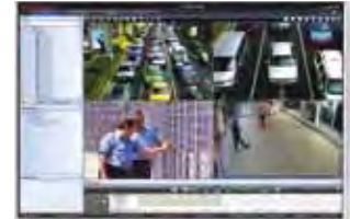
MAXPRO VMS Client Viewer 2x2