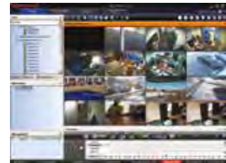
MAXPRO VMS Client Viewer 4x4