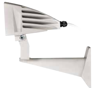
GEKO IRN 24VAC/12-24VDC