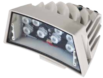
GEKO IRN 24VAC/12-24VDC WEISSES LICHT