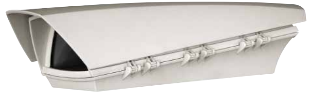
PUNTO + SONNENSCHUTZDACH