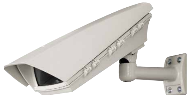
PUNTO + WBOVA2