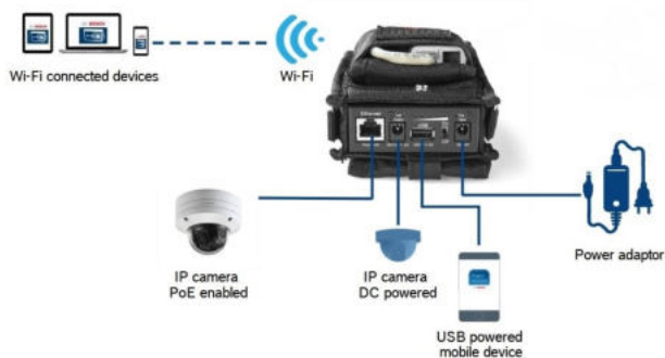
Anschluss für tragbares Kamera-Installationstool