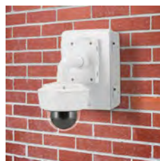
AXIS T98A18-VE Überwachungsschrank