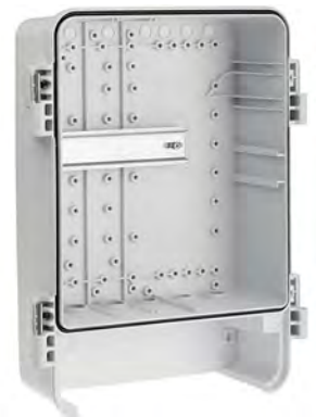
Links: Leichter Überwachungsschrank aus PolycarbonatMitte: Scharnieranschlag bei 105°Rechts: Vormontierte DIN-Profileschienen