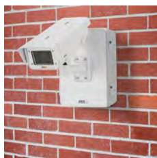
AXIS T98A16-VE Überwachungsschrank