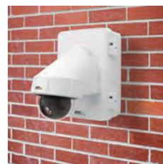
AXIS T98A19-VE Überwachungsschrank