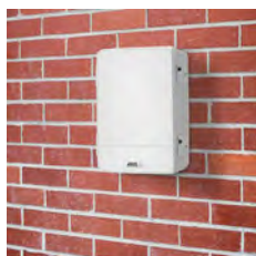
AXIS T98A15-VE Überwachungsschrank