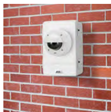
AXIS T98A17-VE Überwachungsschrank