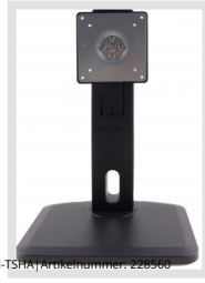
VM-TSH | Artikelnummer: 226566