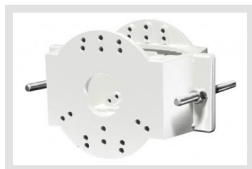
EDC-PM7-W | Artikelnummer: 220492