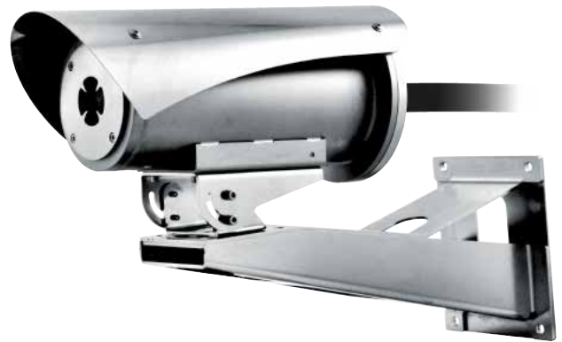
MVXT + NXWBS1