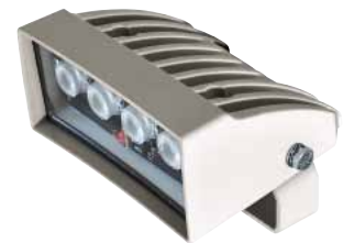
GEKO IRH WEISSES LICHT