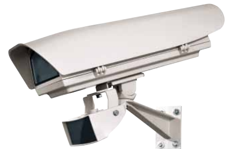
HOV + OSUPPIR + GEKO IRH + WBJA