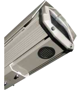
HEG: AUSFÜHRUNG MIT KÜHLSYSTEM